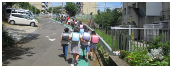
↑一列に並んで帰宅しました。