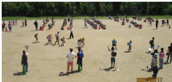
↑訓練ではまず、学年ごとに整列し、地区ごとに並び替えました。↑