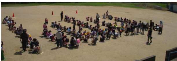
↑一斉下校の目的と注意を聞いています。